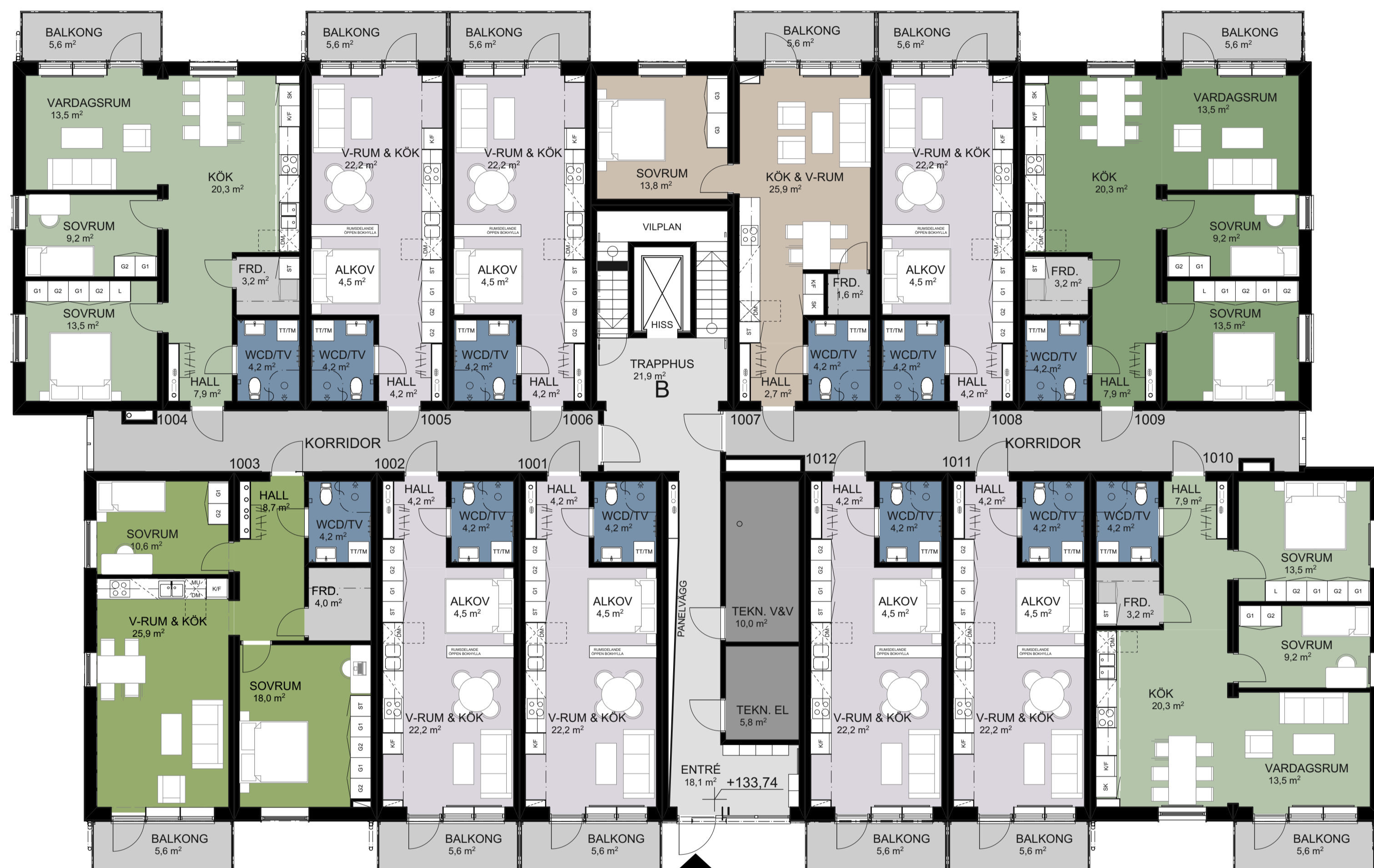
HUS B1: PLAN 1