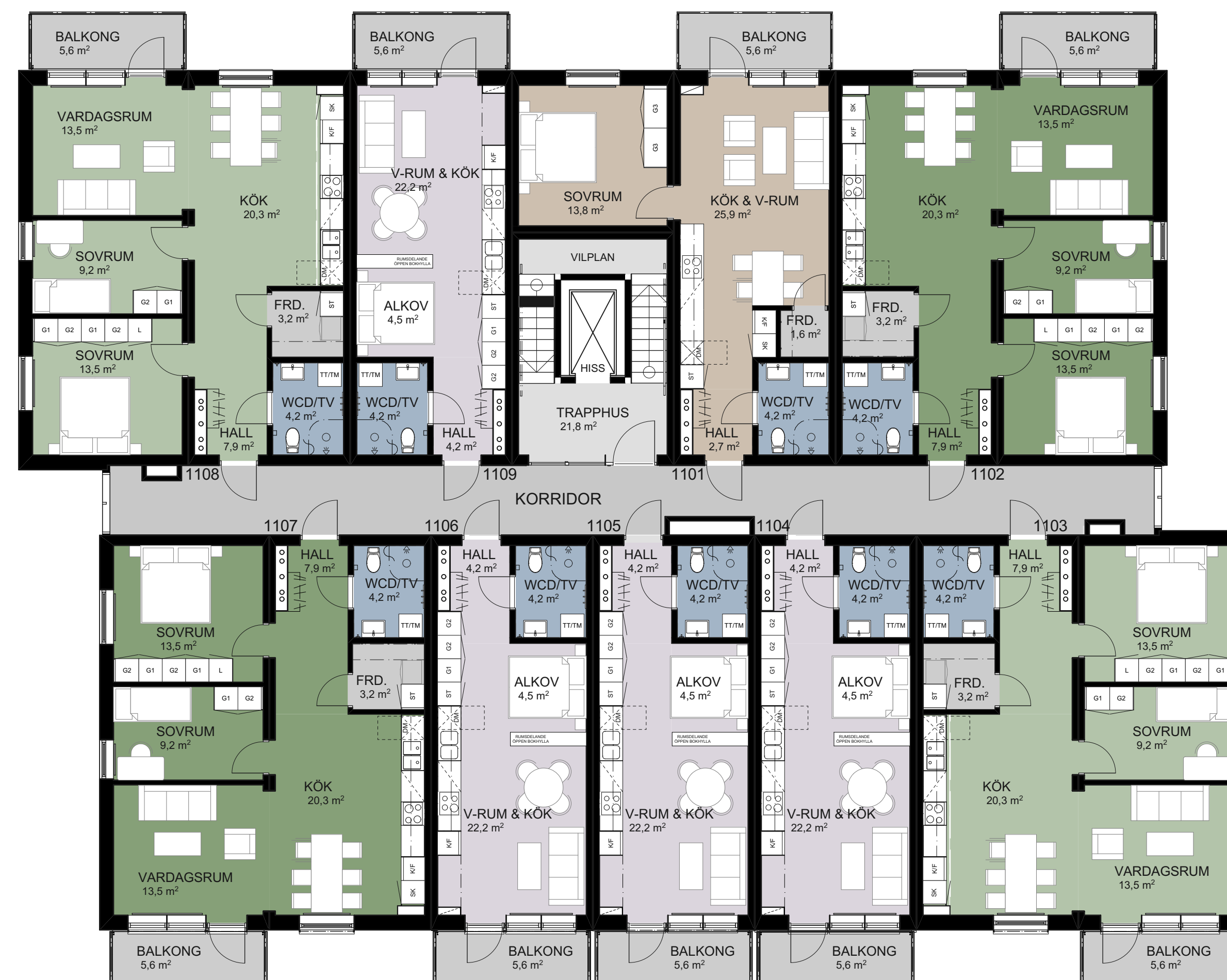
HUS A1: PLAN 2