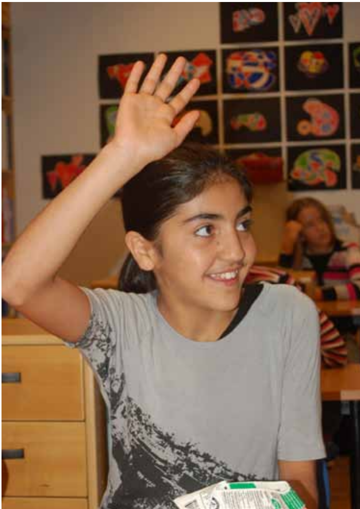
DET VAR MÅNGA HÄNDER I LUFTEN PÅ "MILJÖLEKTIONEN".